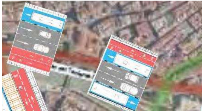
Imagen del anexo complementario 8 Anexo Complementario 8. Memoria valorada carriles bus y bici.