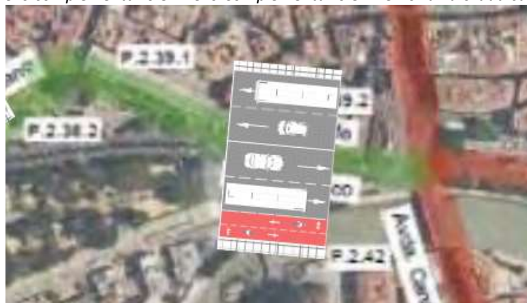
Imagen del anexo complementario 8 Anexo Complementario 8. Memoria valorada carriles bus y bici.