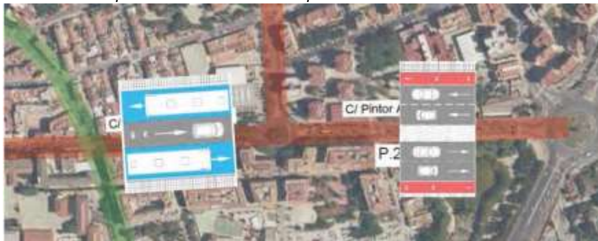
Imagen del anexo complementario 8 Anexo Complementario 8. Memoria valorada carriles bus y bici.